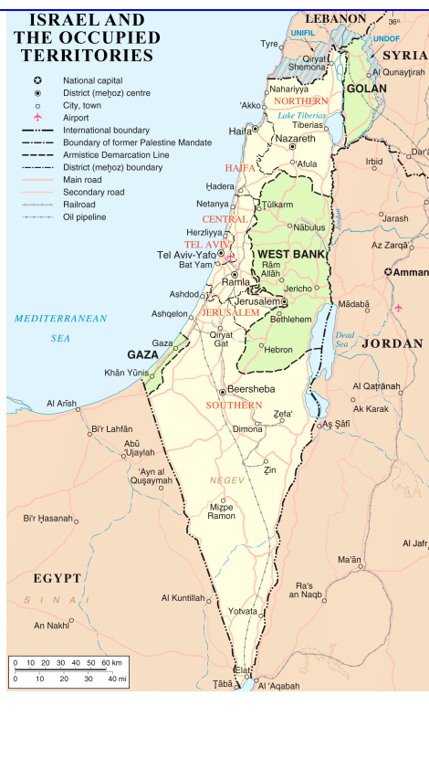
ISRAELE E I TERRITORI OCCUPATI