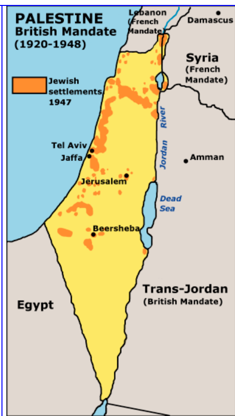
MANDATO BRITANNICO 1920-1948