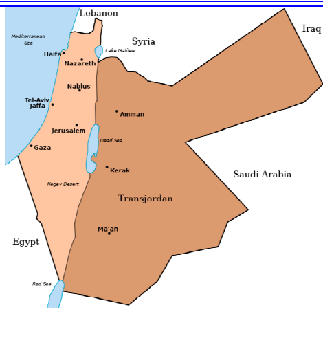
PALESTINA 1A GUERRA MONDIALE