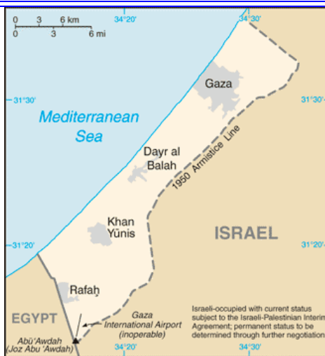
STRISCIA DI GAZA